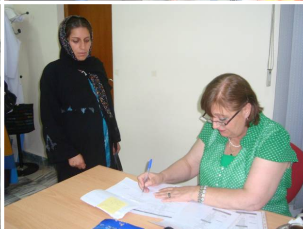
پشکینا نافرەنان ل بنگەهی ریکخراوا هیقی