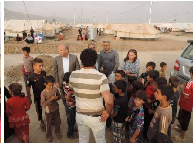
خاتین بخشان و بهریز فخری سهره‌دانا ریقه‌به‌ریا چاقدیری و پیش‌خستنا جفاکی، ریقه‌به‌ریا تورا پاراستنا جفاکی و د گهل بهریز مازن محمد سعید قایمقامی قه‌زا سیمیلی جقیان ژ بوپتر زانینا پینتقیین په‌نابه‌را ودیتنا جهین باش ژ به نه‌نجامدانا پروژی پینشیا‌ز کری ب هه‌فکاریا ریقه‌به‌ریا که‌مپی ل باجد گه‌ندا ل نه‌وا به‌ریزین نا‌فبری سهره‌دان کری. پروژه تا نه‌ا ل ژیر فه‌کولینن دایه و نریک دی بیته راستی.