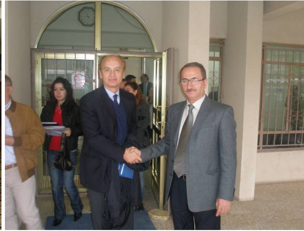
عميد كلية الطب