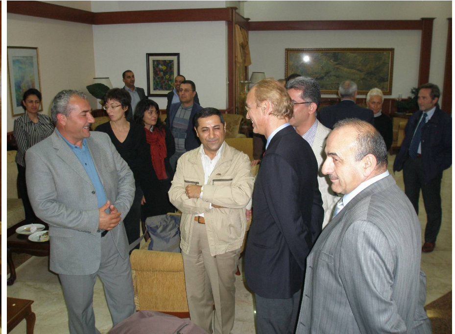
محافظ دهوك و مدير عام صحة المحافظة