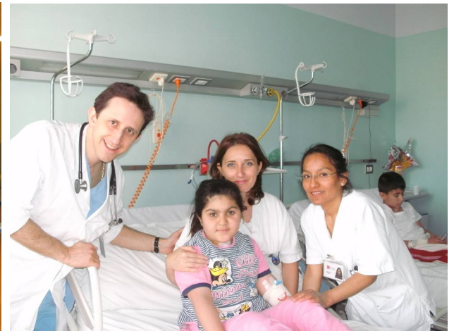
نه خوشين دلی بين زمکای نهوین هاتينه هارتن بو وهلاتی ئیتالیا- میلانو ب هه فکاری دگه‌ل ریخراوا ( Cuore Fratello )