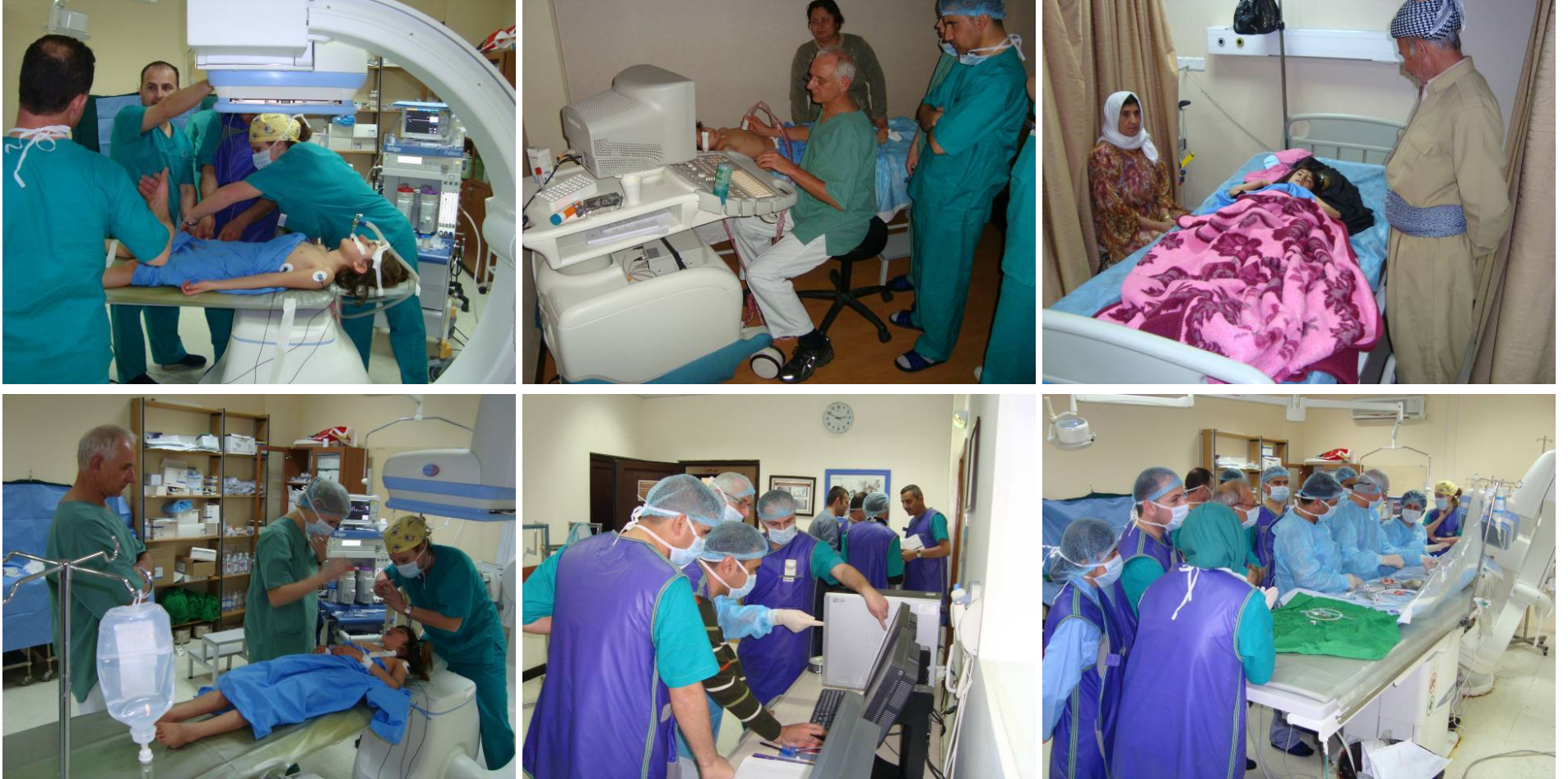
مجموعة صور مختارة للفريق الطبي الالمانى للقسطرة فى مستشفى آزادي العام – دهوك