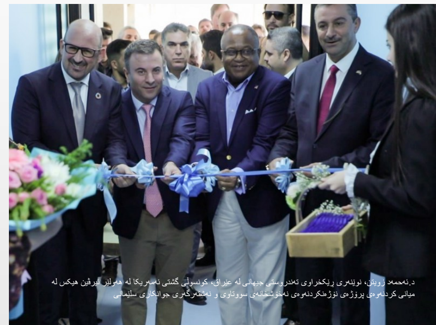
د. نەحمەد زوینن، نوینمري ريکخراوي تەندروستی جیهانی له عێراق، کونسولی گشتی ئەمەریکا له هەولێر فیرین هیکن له میانێ کردنەوهی پرۆژە نوژنکردنەوهی نەخۆشخانە سوتواری و نەشتەرگەری جوانگاری سلیمانی