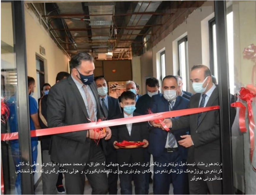
د. نهدم رمشاد نيسماعيل نوښنمري ريکخراوی تهنډروستی جیپهانی له عیراق، د. محمد محمود نوښنمري هیڅی له کاتی کردنهوی پروژ میگ نوزمکردنهوی پهکهی چاودیزی چری تازمطباکبوان و هولی نشتنمگرگری له نمخوشخانهی مندالبونوی هاولیز