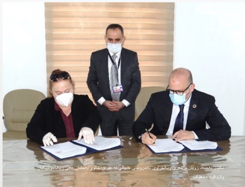
دکتور نەحمەد زوینن نوینمري ريکخراوي تەندروستی جیهانی له عێراق خاتوو بەخشان عملي ريککەوتنێکیان واژۆکرد - دەهوک