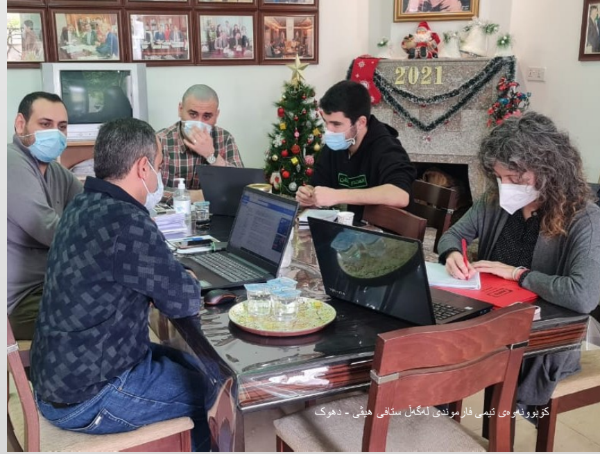
کزیونتهوی تیمی فارموندی لهگهل ستافی هیڅی - دهوک