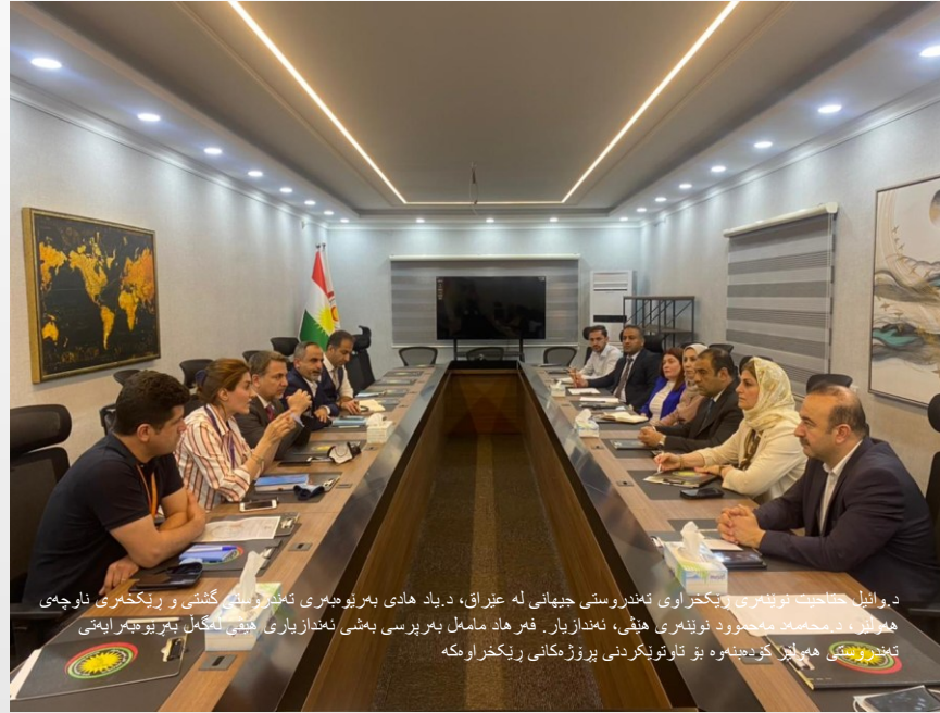
دوانیل حناحیت نوښنمري ريکخراوی تهنډروستی جیپهانی له عیراق، د. یاد هادی بهریو بهری تهنډروستی گشتی و ريکخراوی ناوچهی هاولیز، د محاسبات موجود نوښنمري هیڅی، نهنډاز یار. فرهاد ماممل بهری پرسی بهشی نهنډاز یاری هیڅی لهگهل بهریو بهری ایتهی تهنډروستی هاولیز کورډینهویه بو تاوتوبکردنی پروژمکانی ريکخراو مکه