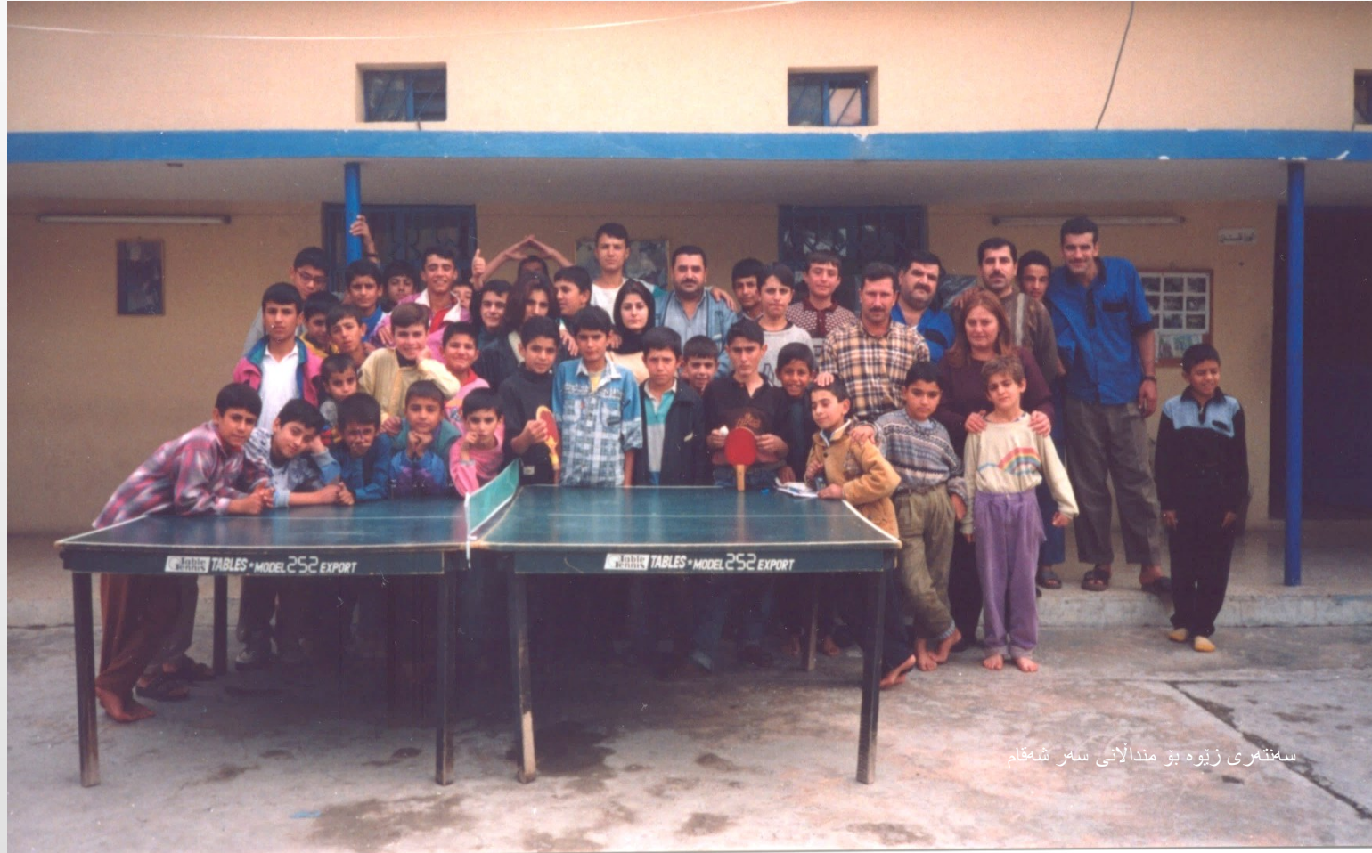
سەنتەری زیوہ بۆ مندالانی سەر شەقام

ئەوان لە ئیتالیا دەست دەکەن بە گەران بەدوای پزیشکەکاندا کە نامادەن یارمەتیمان بدەن لە چارەسەرکردنی ئەم مندالانە.. لە سەرەتاهە ئاسان نەبوو. لە کۆتاییدا لە ساڵی ۲۰۰۵ دا ریکخراوی (IME) د. ئیلجا گەردی) و پزیشکە ئازاکانی نەخۆشخانە بەناوبانگەکانی مندالانی ئیتالیا و لە کۆمەڵەی "مندالانی نەخۆشی دڵ لە جیهاندا" یان ناسی کە نامادەبوون یارمەتیدەرمان بن لە چارەسەرکردنی مندالەکانمان کە بەخشان بەدەوام بوو لە بەشداریکردن لە هەمیشە لیستی درێژتر.