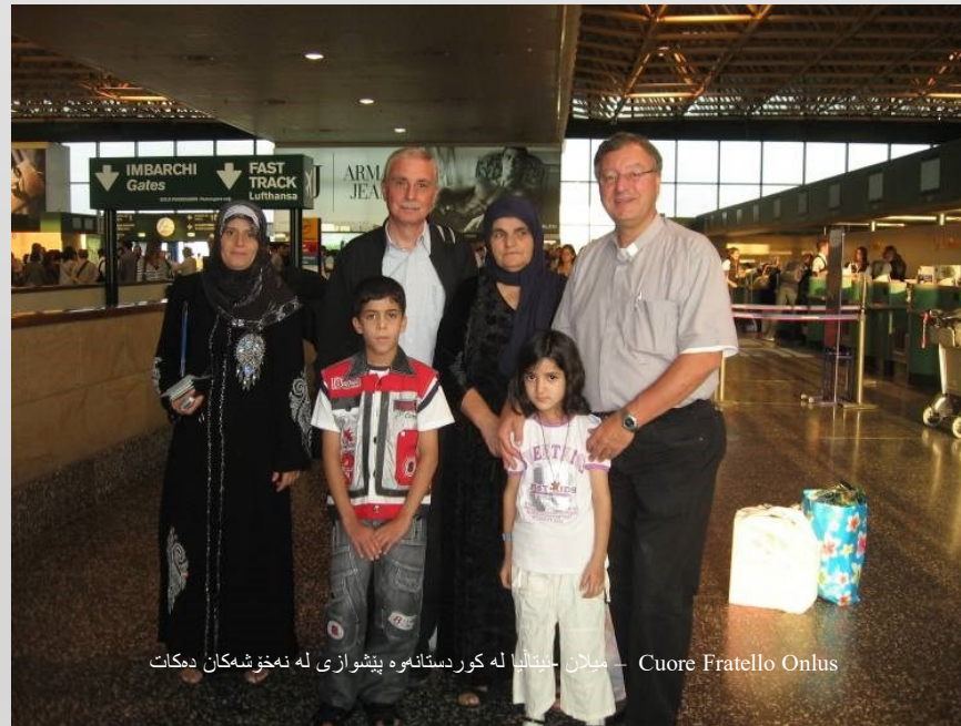
Cuore Fratello Onlus — میلان ئیتالییا له کوردستانهه پێشوازی له نهخۆشمان دمکات

بالیوز خانهای ئەمریکا راستموخۆ پالپشتی زۆریک له پروژه تندرستییهکانی ریکخراوی هیفی کردوه له سالانی ۲۰۰۶ تا ۲۰۱۰ ههروهه ناکتیره مرۆبیهکانی ئەلمانییا وهک کۆمهلهی ئەلمانی بۆ هاوکاری نیودهولتیی (giz)، بهو پێیبهی ئەم دهزگابه پشنگیری زۆریک له پروژهکانی ریکخراوی هیفی کردوه له ماوهی سالانی پێشوویدا. هاوکاری نیوان هیفی و کۆمهلهی ئیتالی کۆر فراتیلۆ له سالانی ۲۰۰۶ ههروهه بووه هۆی ئەنجامدانی نهشتەرگهیری بۆ زۆریک لهو مندالانهی که توشی نهخۆشی زگمکی دڵ بوون به پالپشتی کۆر فراتیلۆ.