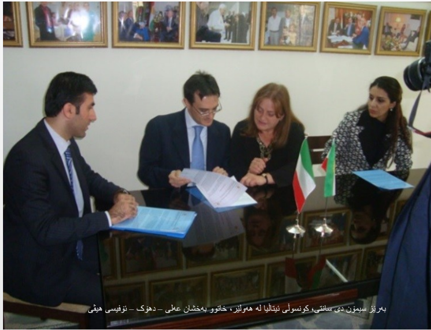
بهریز سیمۆن دی سانتی، کونسولی ئیتالیا له ههولێر، خاتوو بهخشان عملی - دهوک - نوێسی هیفی