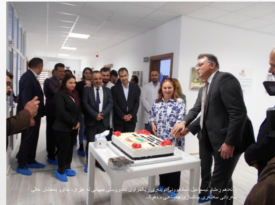
د. نهدهم رشاد نيسما عيل نامادهووني نوينمري ريکخراوي تەندروستی جیهانی له عێراق، خاتوو بەخشان عملي سەردانی سەنتەری چاکسازی جەستەیی - دەهوک