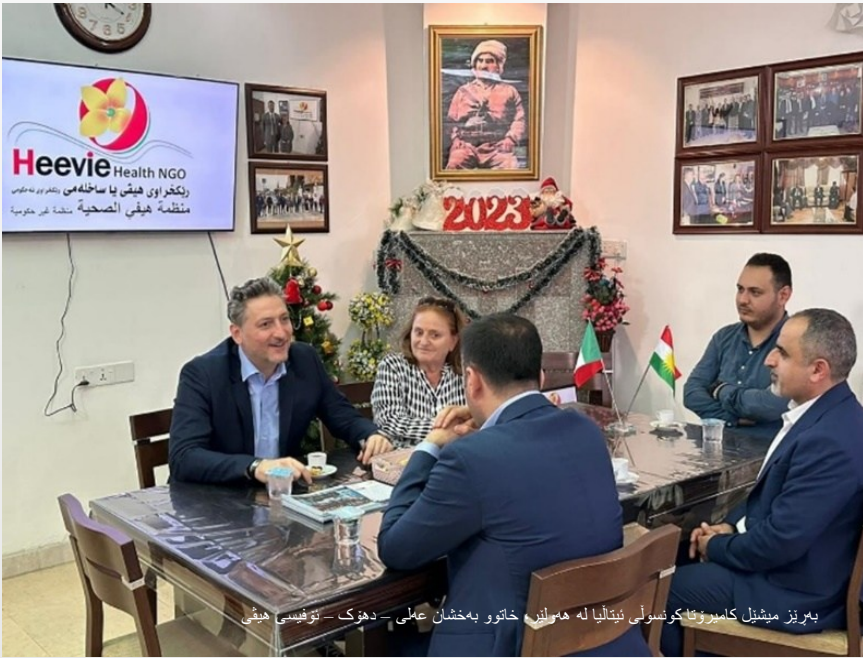
بهریز میشل کامیونتا کونسولی ئیتالیا له ههولێر، خاتوو بهخشان عملی - دهوک - نوێسی هیفی