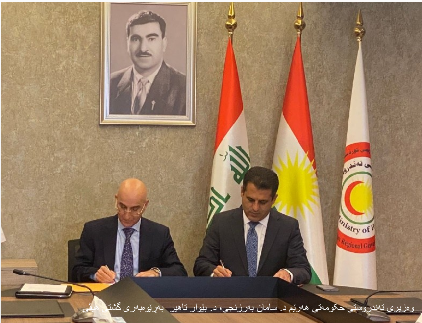
وهزیری تهنهروستی حهکومتی ههریم د. سامان بهرزنجی، د. بیوار تاهیر بهرئوبهیری گشتی