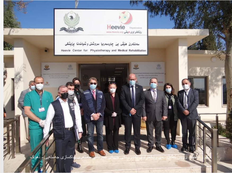
کتور لهگهل زویین لهگهل تیمی ريکخراوی تهنډروستی جیپهانی عیراق هیڅی هیڅی جاکساز ی جستهی - دهوک