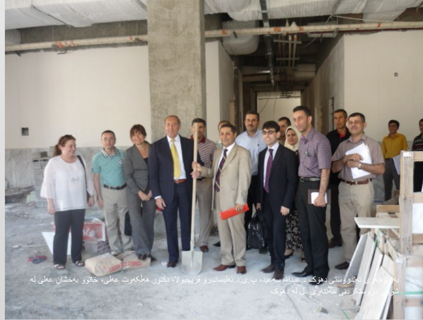
بهریو بهری تاندروستی دهوک د.عبدالله سعید، پ.ی.د.نطیساندرو فریجیولا، دکتور هملکوت عملی، خاتوو بهخشان عملی له شونډی دروستکردنی سامنتری دل له دهوک