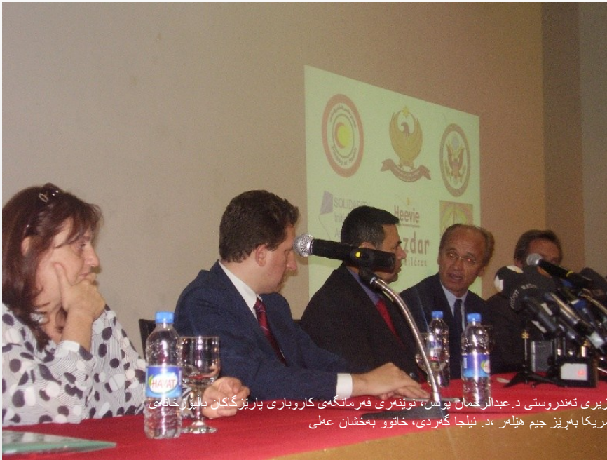
وزیر تندرستی د. عبدالرحمان یوش، تویندری فیرمانگهی کاروباری پاریز کاکان بالیوز خانهای آمریکا بهریز جیم هیلر د. نیلجا گوردی، خاتوو بهمشان عملی