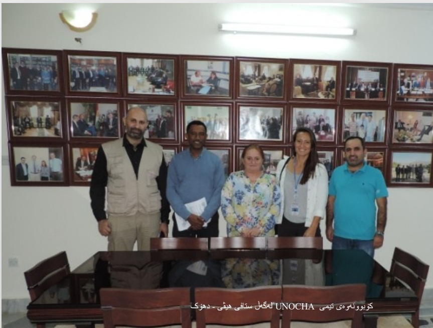
کزیونتهوی تیمی UNOCHA لهگهل ستافی هیڅی - دهوک