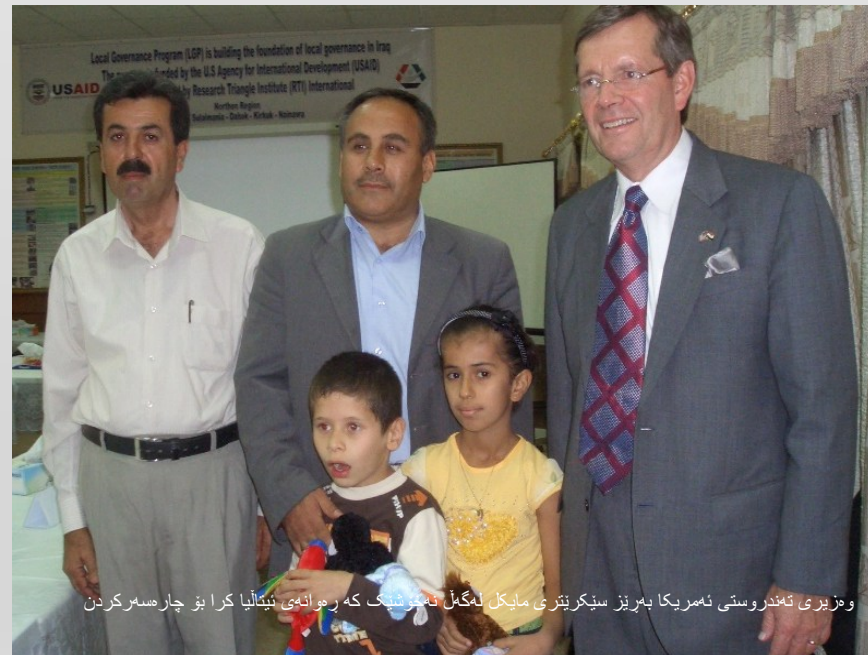
وهزیری تندرستی ئەمریکا بهریز سنیکرینتری مایکل لهگهڵ نهخۆشیک که روانهیی ئیتالییا کرا بۆ چارەسەرکردن